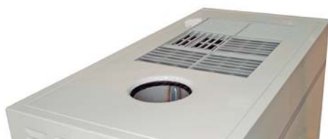
Rejilla de aire multidireccional Multidirection air grid multidireccional Grille d'air multidirectionnel