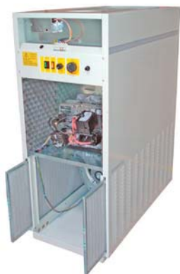
Quemador insonorizado. Filtro de admisión de aire. Sound insulated burner. Air inlet filter. Brûleur insonorisé. Filtre d'admission d'air.