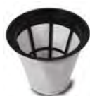
Filtre tissu 3240 (FTDP28733)