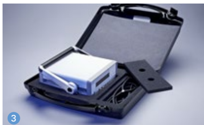
Transportkoffer KAL 100/200 Best.-Nr. 9220.0002