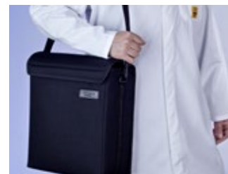
Tragetasche KAL 100/200 bereits im Lieferumfang enthalten