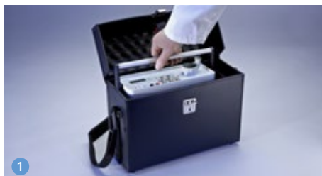
Tragetasche KAL 84 Best.-Nr. 9062.0001