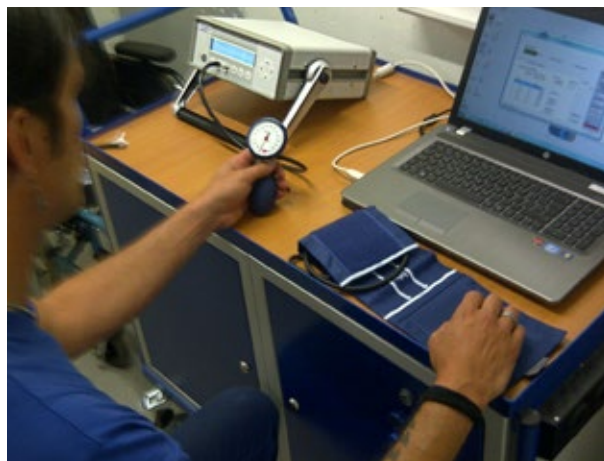
Aus der Praxis: So werden die Blutdruckmessgeräte im Pflegeheim Solina in Spiez (Schweiz) vom verantwortlichen Techniker kalibriert

Bei dieser Vorgehensweise unterstützt Sie der akkugestützte Druckkalibrator KAL 200 von halstrup-walcher optimal. Über die PC-Software können Sie Drucksequenzen vorprogrammieren und speichern. Der Druckgenerator des KAL 200 erzeugt den Sollwert jeweils höchst präzise – der Istwert wird am Blutdruckmessgerät abgelesen. Die Istwerte werden direkt vor Ort in standardisierte Prüfungsprotokolle eingetragen, die Sie in der Gebäudemanagement-Software des Kranken- oder Pflegeheims verwalten können. So sind die Daten zu jeder Zeit verfügbar.