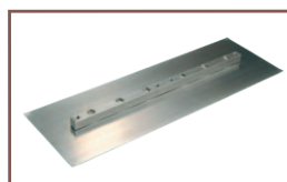
Pale de finition