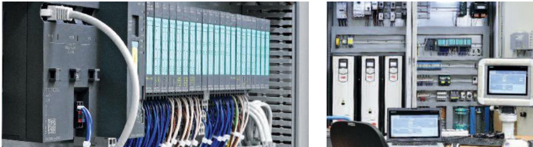
Individuell angepasste Lösungen stehen in unserem Testcenter auf dem Prüfstand