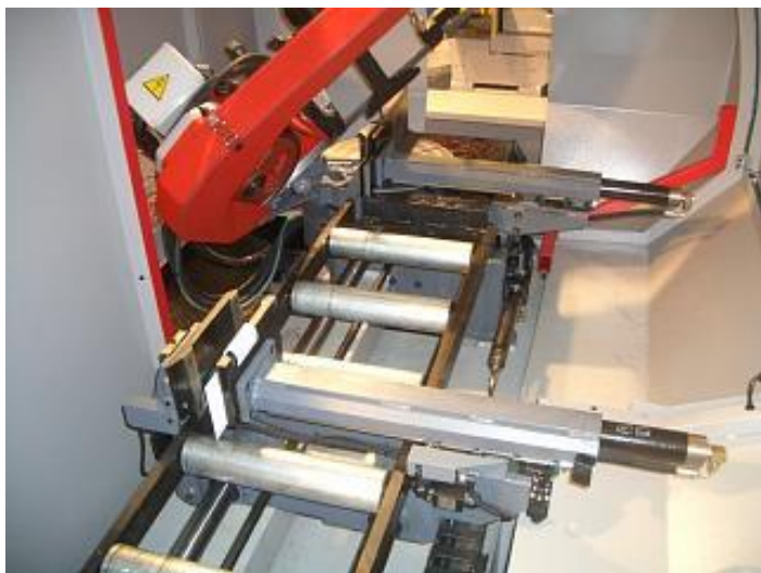
Chemin avec étai avance-barre