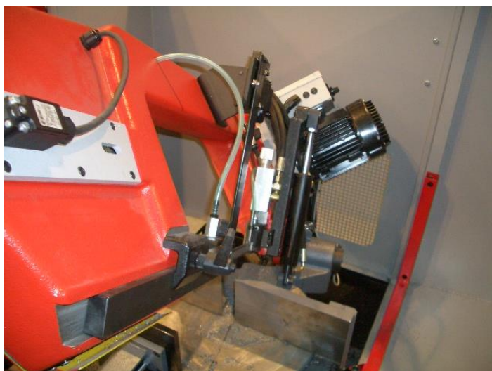
Vérin de descente et palpeur approche rapide archet