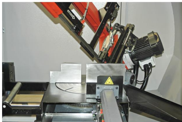
Étau principal et plateau tournant