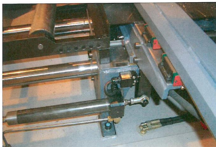
Vérin déplacement étai