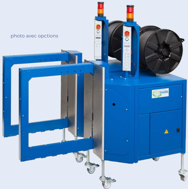
photo avec options