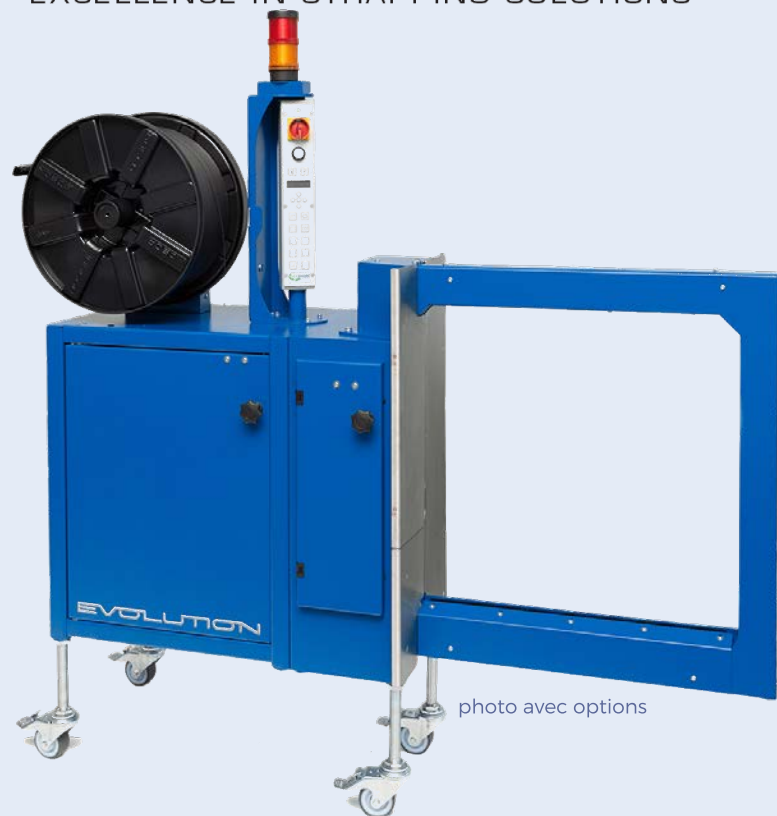
photo avec options