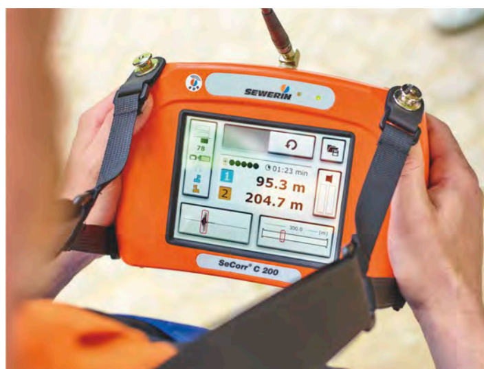
Résultat de mesure à l'écran SeCorr® C 200