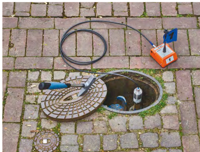
Émetteur radio RT 200 utilisé avec un micro UM 200

Le SeCorr® C 200 permet une manipulation légère et ergonomique. Prévu avec une ceinture, il permet un port optimal et sans fatigue. Le boîtier construit de manière compacte et symétrique permet aux droitiers comme aux gauchers une commande tout aussi commode. La communication entre le récepteur et le casque d'écoute a lieu sans fil de sorte que l'utilisateur peut travailler très confortablement.