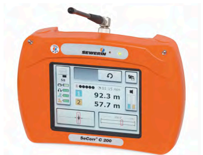
Récepteur SeCorr® C 200