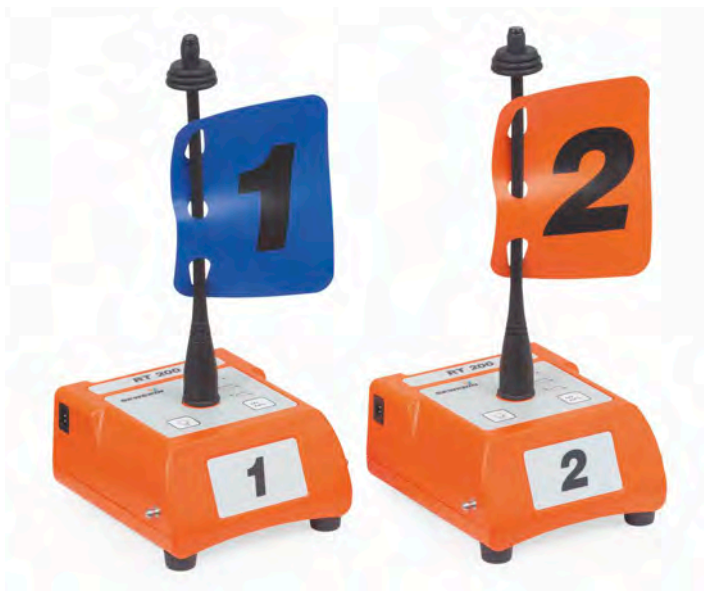
Émetteur radio RT 200

Grâce à la vue centrée sur le résultat, l'utilisateur peut immédiatement amorcer les autres étapes, par exemple, confirmer la localisation avec un procédé acoustique.